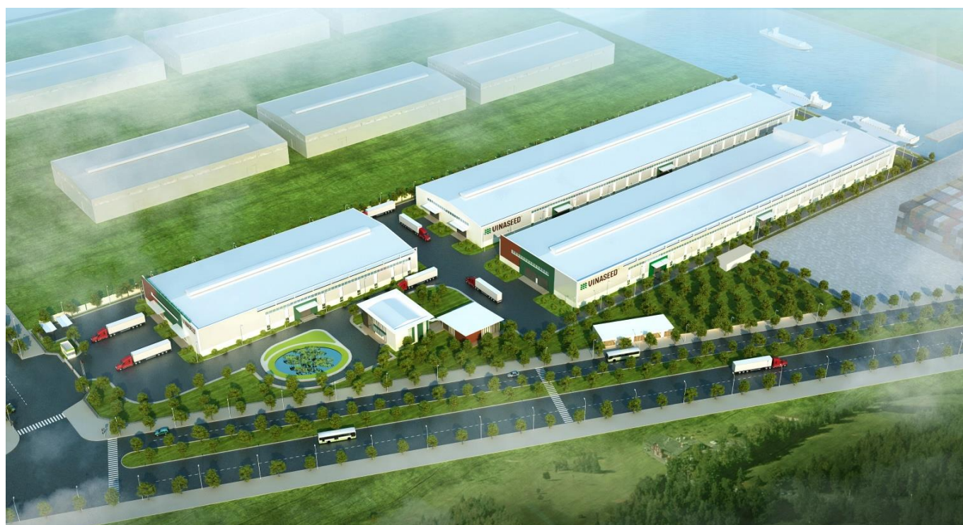
Ảnh: Dự án trung tâm công nghiệp chế biến hạt giống và chế biến nông sản Đồng Tháp