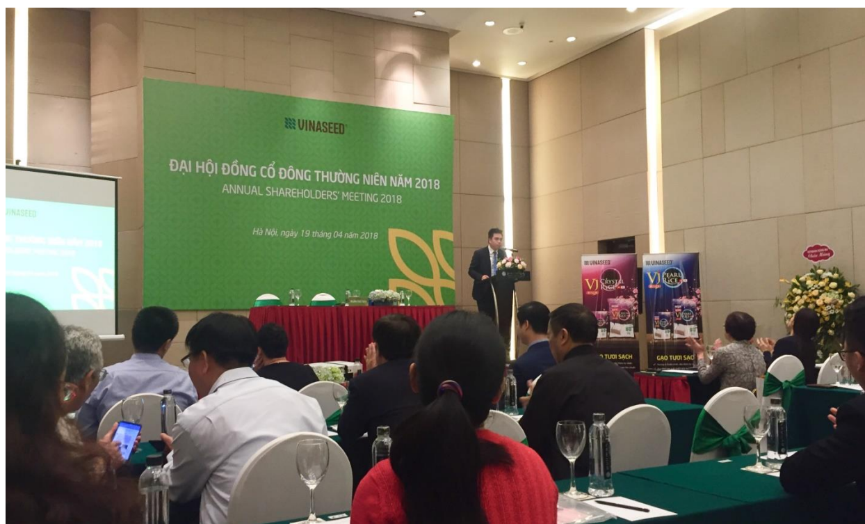
Ảnh: Khai mạc Đại hội đồng cổ đông thường niên 2018

N gày 19/4 công ty CP Giống cây trồng trung ương tổ chức Đại hội đồng cổ đông thường niên 2018. Đại hội đã đưa ra những quyết sách quan trọng, đánh dấu bước chuyển mình lớn mạnh của Vinaseed.